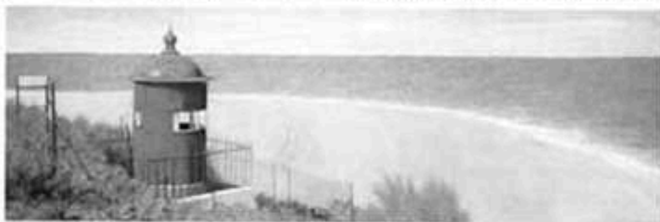
« La plage », 2000, (180 x 60 cm).