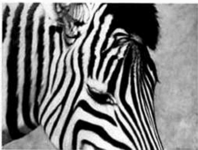
« Nina », 2000, (130 x 97 cm).

guerrier. L'artiste le peint au repos, majestueux, mythique, non pas dans sa jungle natale mais sur une dalle taillée dans le roc. Il symbolise le pouvoir absolu, la cruauté latente à l'état pur même si l'artiste nous le montre sous son meilleur jour. La technique de Bourquin s'apparente aux maniéristes animaliers s'étant épurés de tout artifice. Sa peinture capture l'instant. Il cadre en gros plan la bête, juste pour souligner qu'elle sent, qu'elle souffre, qu'elle entend nos interrogations. Ses zèbres, ses